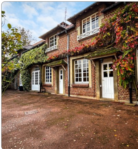
Maison bourgeoise – FAUQUEMBERGUES

Idéalement située sur l'axe Saint-Omer / Le Touquet, à seulement 18 km d'Helfaut et 22 km de Saint-Omer, cette superbe maison bourgeoise de 360 m 2 allie charme, volumes généreux et authenticité, au cœur d'un village offrant toutes les commodités.